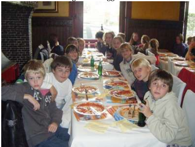
Uitwisseling met Brugge in 2010

Groep 7/8 gaan 1 maal per 2 jaar op schoolkamp. Het andere jaar vindt er een uitwisseling plaats met een school uit het Belgische Brugge.