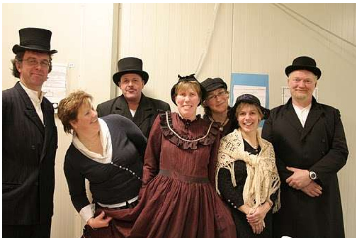
Leden oudervereniging tijdens Kerstmarkt