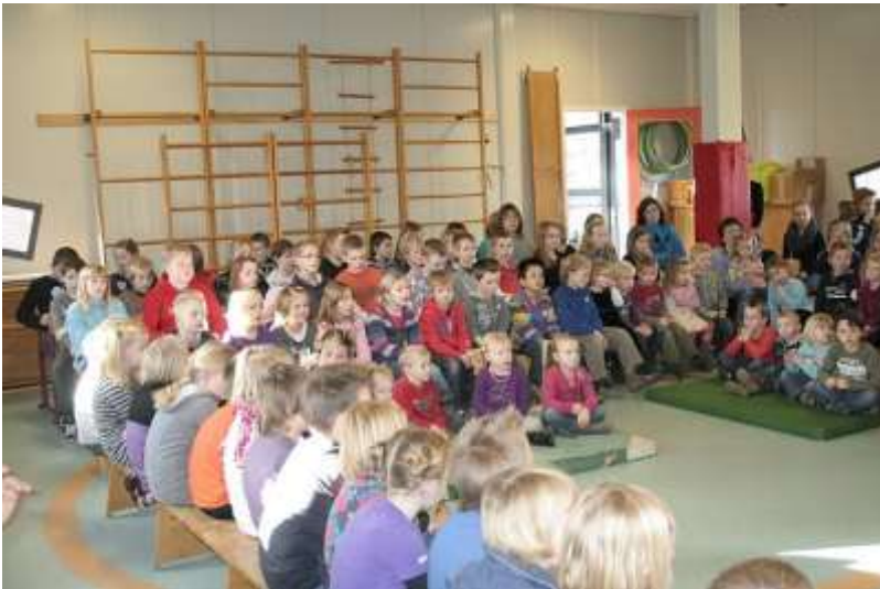
Uitreiking opbrengst Kerstmarkt

Onze school is opgericht in 1921 door katholieke ouders die katholiek onderwijs wilden voor hun kinderen. Vandaag de dag betekent dit dat wij een 'open' katholieke school willen zijn. Dat wil zeggen dat iedereen die zich aangesproken voelt door onze vorm van onderwijs, welkom is. U herkent het katholieke karakter allereerst door de visie waaruit wij werken, waarbij wij ons mede laten inspireren door de verhalen vanuit de Bijbel. Ook vindt u deze duidelijk terug in de praktische invulling van delen met en geven aan de minderbedeelden. Dit doen we door diverse acties en activiteiten.