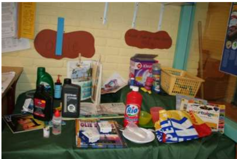
Thema olie in groep 2