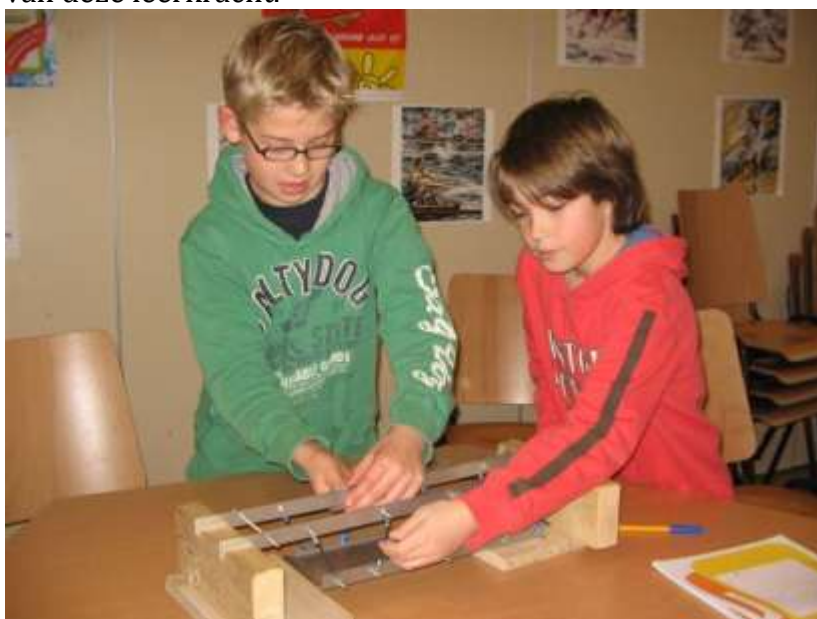
Techniek in groep 7

De groepsleerkracht verzorgt het primaire onderwijsproces in de groep: hij/zij bereidt de lessen voor, geeft les, begeleidt de leerlingen en houdt hun vorderingen bij. Omdat de groepsleerkracht en ouders belangrijk zijn in het ontwikkelingsproces van kinderen, behoort het contact met de ouders tot taak van deze leerkracht.