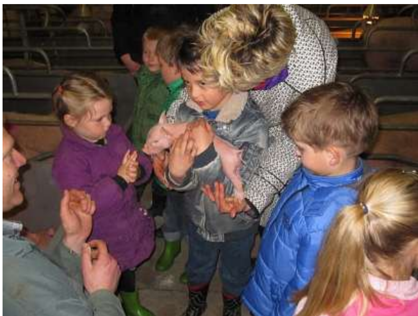
Bezoek aan de boerderij van groep 1

De deur van de school gaat 15 minuten voor de aanvang van de school open. Stuurt u uw kind(eren) a.u.b. niet te vroeg naar school. Het is voor jonge kinderen een extra belasting om bv. al een kwartier eerder in de kring te zitten! Voor de kinderen die te vroeg zijn of 15 min na schooltijd nog op het plein aanwezig zijn, draagt de school geen verantwoordelijkheid.