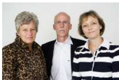
Leden collega van bestuur van Catent

Omdat iedere school haar eigen identiteit en aanpak heeft, berusten de taken van het bestuur zoveel mogelijk bij de directie, schooladviescommissies en medezeggenschapsraad, zodat iedere school haar eigen beleid kan blijven voeren.