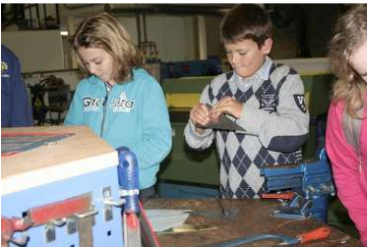
Open dag op het Lindecollege

NB. Er zijn schoolkeuzebureaus waar kinderen getest kunnen worden op eigen kosten. Inlichtingen zijn op school te verkrijgen.